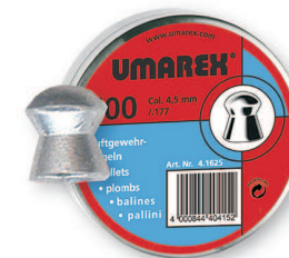
Śrut Umarex Kod produktu: 4.1625