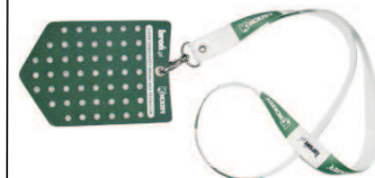
Zawieszka na śrut Kod produktu: ZKO.5001.2