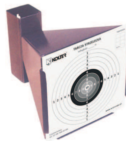
Kulochwyt stożkowy Kod produktu: 3.0144