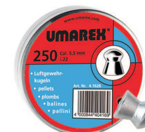
Śrut Umarex Kod produktu: 4.1626