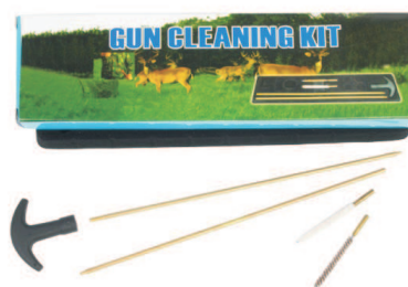
Wycior Lider Kod produktu: SNP-45 lub SNP-55